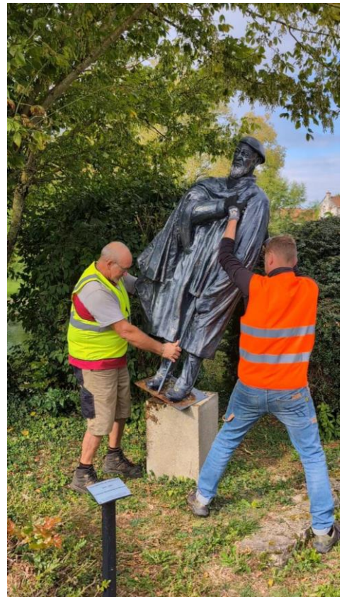
Des agents municipaux ont procédé au déboulonnage de statue de l'abbé Pierre à Norges-la-Ville, le 17 septembre 2024.

Il est amusant de constater qu'après le passage, en avril dernier, de la conjonction JUPITER / URANUS sur la pointe de la maison VIII au carré de VENUS, maîtresse du secteur, PLUTON transite le Fond du Ciel : une remise en question brutale de l'image adulée de l'abbé faisant brusquement remonter à la lumière ses turpitudes soigneusement dissimulées et entraînant la destruction symbolique du socle sur lequel sa statue avait été édifiée !