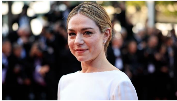
Figure incontournable du cinéma francophone, Émilie Dequenne est une comédienne d'origine Belge aux 50 rôles. Elle est découverte à l'âge de 17 ans par les frères Dardenne et révélée au festival de Cannes en 1999 pour le film Rosetta. L'actrice mène alors une carrière éclair récompensée par de nombreux prix, aux Césars notamment.

En 2023, sort le film catastrophe "Survivre" dans lequel l'actrice doit se battre contre le cancer. La même année elle apprendra qu'elle est atteinte d'un cancer très rare du système endocrinien.